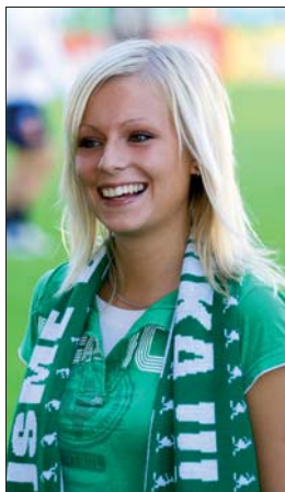
Loňská Miss Kenguru